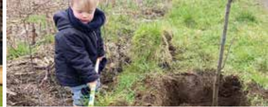
Nieuw bos in Heist (p. 3)