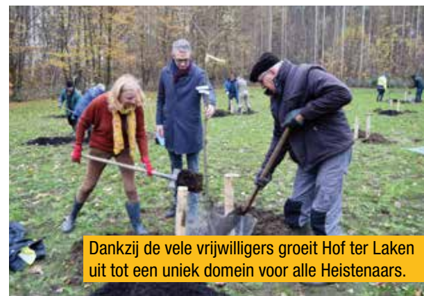
Dankzij de vele vrijwilligers groeit Hof ter Laken uit tot een uniek domein voor alle Heistenaars.

Het park werd opgeruimd en het dak werd geres- taureerd. Dat was nodig. Ook de orangerie aan de remise wordt hersteld. Voor de renovatie en herstellingen aan de remise en het kasteel zijn er Vlaamse subsidies waardoor de herbestem- ming mogelijk wordt.