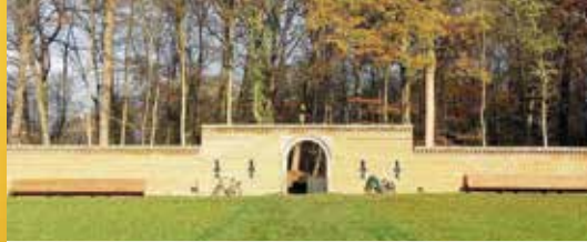
Er groeit wat in Hof ter Laken (p. 2)