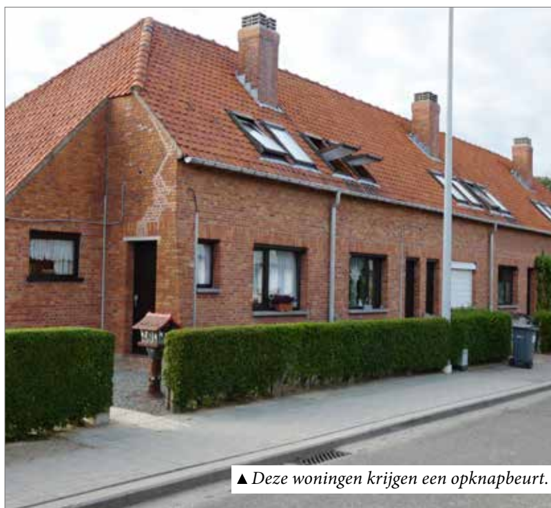
▲ Deze woningen krijgen een opknapbeurt.

Daarnaast wil de N-VA een correcte naleving van de regels bij gebruik van sociale woningen. Alleen als we misbruik aanpakken, zorgen we ervoor dat hier plaatsen vrijkomen voor mensen die het écht nodig hebben.