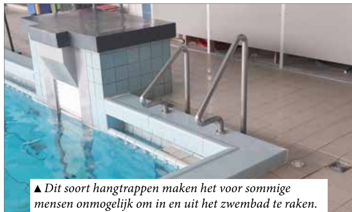
▲ Dit soort hangtrappen maken het voor sommige mensen onmogelijk om in en uit het zwembad te raken.