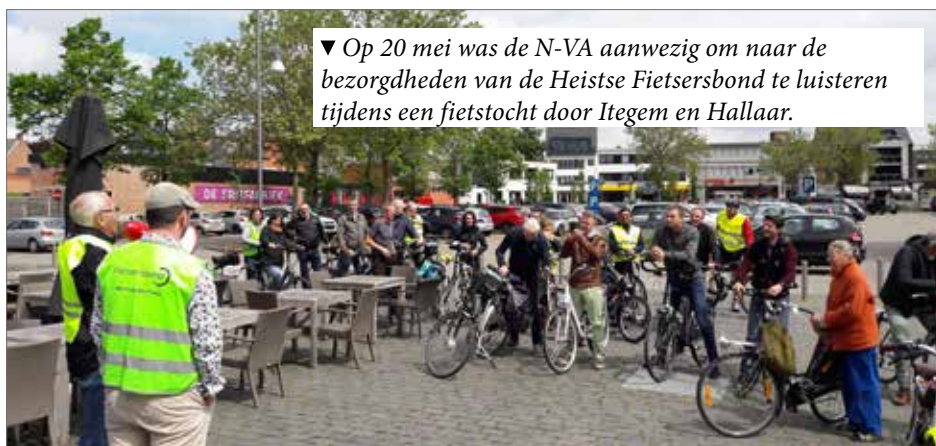
▼ Op 20 mei was de N-VA aanwezig om naar de bezorgdheden van de Heistse Fietsersbond te luisteren tijdens een fietstocht door Itegem en Hallaar.

Dankzij de Vlaamse investeringen wordt daar binnenkort een vrijliggend, veilig fietspad aangelegd. Dat laat toe dat u dit traject vlot en veilig per fiets zal kunnen afleggen. Met dank aan N-VA-minister Ben Weyts.