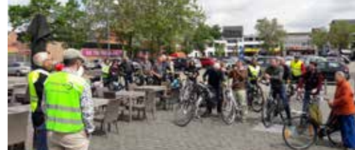
Vlaanderen investeert in onze gemeente p.3