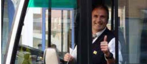
Eindelijk aandacht voor beter busvervoer p.2