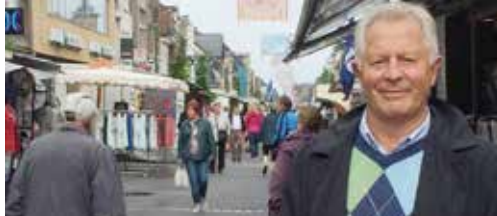
Waarheen met de maandagmarkt? p.2