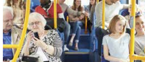
Snel betere buslijnen in Heist p.3